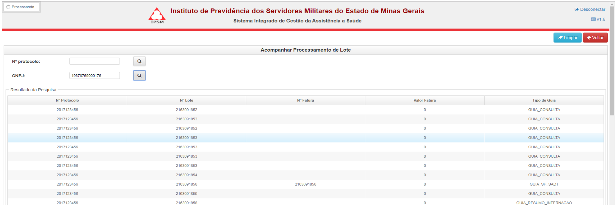
Figura 4.1 – Processamento de Lote