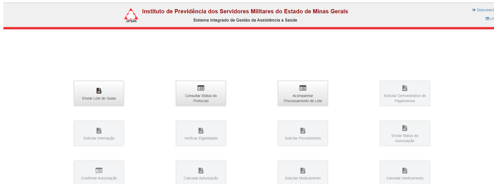
Figura 1.0 – Menu Principal